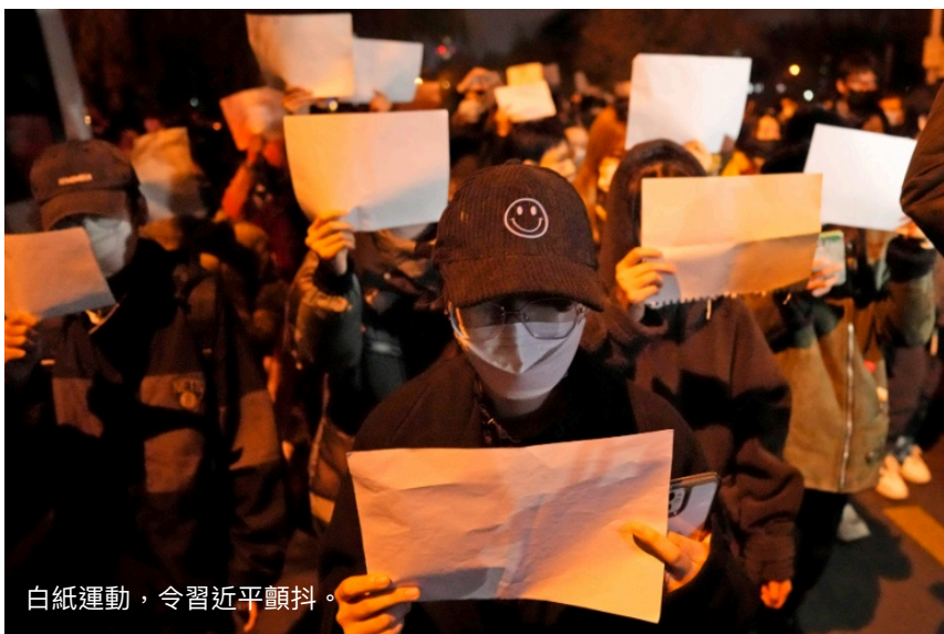
白紙運動，令習近平顫抖。

維穩開支？因此政府只有兩個選擇，一是更強力鎮壓，把民怨壓下去，一是向民意讓步，希望減少矛盾衝突，前者可能引發更大規模的民變，後者可能失去政權的威懾力，權衡利弊之下，政府開始學會向民眾低頭。